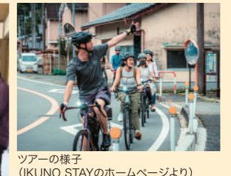
ツアーの様子 (IKUNO STAYのホームページより)