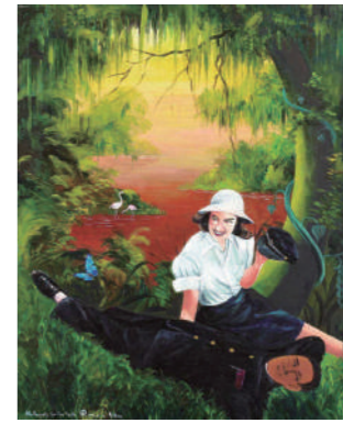
(我が青春に悔いなし) 1994年 作家蔵(横尾忠則現代美術館蔵)