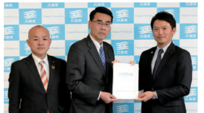
3/20 齋藤知事に公明党として申し入れ

3月20日、県議会公明党として齊藤知事に、県民生活を直撃している物価高騰対策として①電子クーポンによるプレミアム付き商品券発行事業の実施、②LPガス利用の一般家庭の負担軽減策の2点について申し入れを行いました。国の地方創生臨時交付金を活用し、6月議会で成立した補正予算で以下の事業の実施が決定しました。